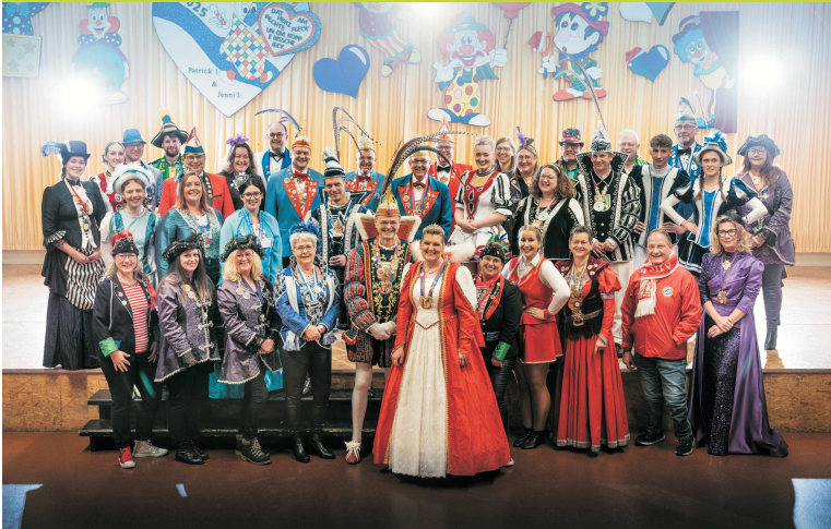
Gemeinsame Fotoaktion aller Karnevalsvereine der Verbandsgemeinde

Fröhliche Karnevalstage in der Verbandsgemeinde Rengsdorf-Waldbreitbach!