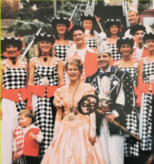
Prinz Michael I. vom Oberbieberer Städtche und Tischtennisclan Prinzessin Silke I. das brave Mädchen aus dem Hause Hahn

Nach 25 Jahr' grüßen wir die Bräpe Narrenschar als Millennium Prinzenpaar